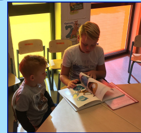
Het maatjeslezen is weer gestart!

EMAIL info@maranathaschool.nl TEL. 0172-520055 WEBSITE www.maranathaschool.nl FACEBOOK Maranathaschool Nieuwkoop TWITTER @maranathaschool