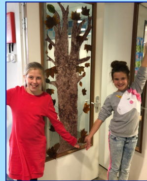
De vrijdagmiddag workshop raamschilderen

EMAIL info@maranathaschool.nl TEL. 0172-520055 WEBSITE www.maranathaschool.nl FACEBOOK Maranathaschool Nieuwkoop TWITTER @maranathaschool