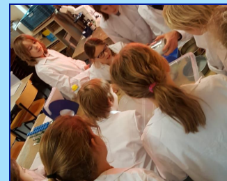
De vrijdagmiddag workshop scheikunde proefjes

EMAIL info@maranathaschool.nl TEL. 0172-520055 WEBSITE www.maranathaschool.nl FACEBOOK Maranathaschool Nieuwkoop TWITTER @maranathaschool