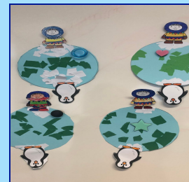
Thema de Noord en Zuidpool OB-3

EMAIL info@maranathaschool.nl TEL. 0172-520055 WEBSITE www.maranathaschool.nl FACEBOOK Maranathaschool Nieuwkoop TWITTER @maranathaschool